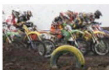
Í MotoMos eru nokkrir af fremstu motocross íðkendum landsins.

„Það hefur borið á því að akstur mótórhjóla sé stundaður þar sem hann á alls ekki heima svo sem á göngu-, hjóla- og reiðstígum. Með